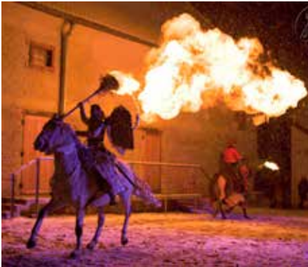
Čertí reje byly opravdu divoké