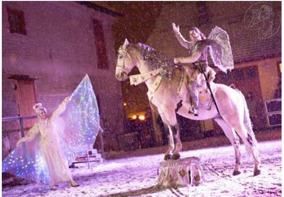
Zasáhnout musela Andělská jízda