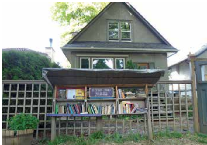
Pouliční knihovna ve Vancouveru