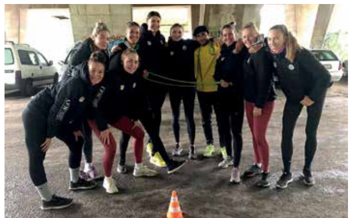
Basketbalistky KP Brno trénovaly v polovině října při uzavření hal a nepřízní počasí pod husovickým mostem

Podporujeme proto jakýkoliv povolený pohyb či sportování při dodržování aktuálních nařízení a nebraňme profesionálním sportovcům (kteří často obětovali celý svůj život obrovské dřině a odříkání) při zachování všech preventivních opatření v jejich činnosti.